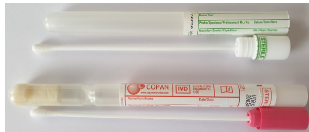
Abb.2: Geeignete Abstrichmaterialien für die SARS-CoV-2 PCR. Benötigt wird ein trockener Abstrich aus Rachen bzw. Nase für den Virusnachweis.

Material: Mittels eines Nasen-Rachen-Abstriches bzw. Rachenabstriches aus den oberen Atemwegen gewonnen.